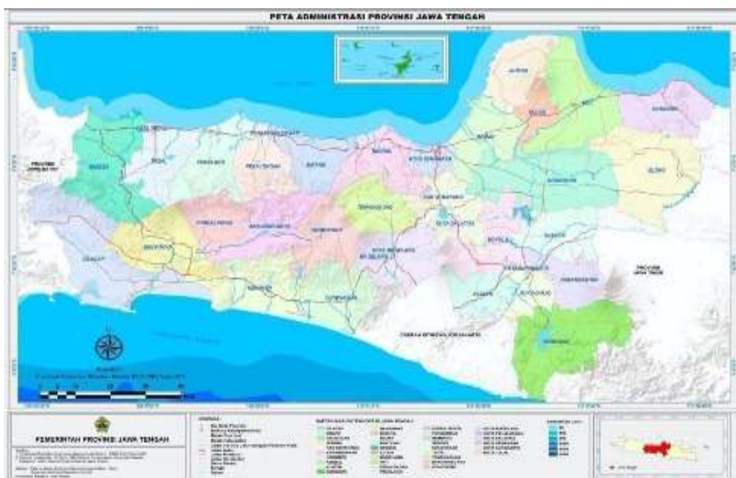
Gambar 1. 1 Peta Wilayah Administrasi Provinsi Jawa Tengah

Topografi wilayahnya sekitar 53 persen berada pada ketinggian 0-99 mdpl yaitu dataran rendah yang tersebar di hampir seluruh wilayah, serta dataran tinggi dan pegunungan yang membujur di wilayah tengah. Provinsi Jawa Tengah memiliki kemiringan lereng topografi yang beragam meliputi lahan dengan kemiringan 0-2 persen sebesar 38 persen; lahan dengan kemiringan 2-15 persen sebesar 31 persen; lahan dengan kemiringan 15-40 persen sebesar 19 persen; dan lahan dengan kemiringan lebih dari 40 persen sebesar 12 persen dari total wilayah.